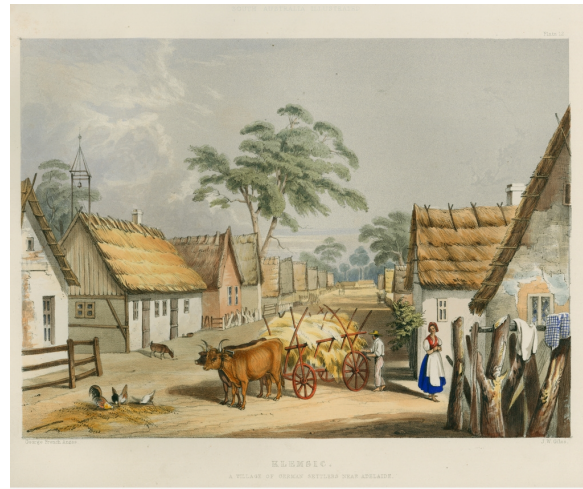
B 15276/12