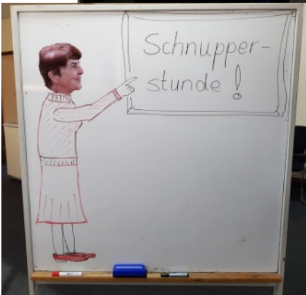
The adult class in their new rooms at the Lyndoch library. Thank you Martin Beales for sending us these great photos. Danke!